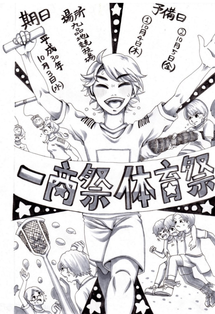
表紙絵：1416梶村佳志乃さん作【美術部】